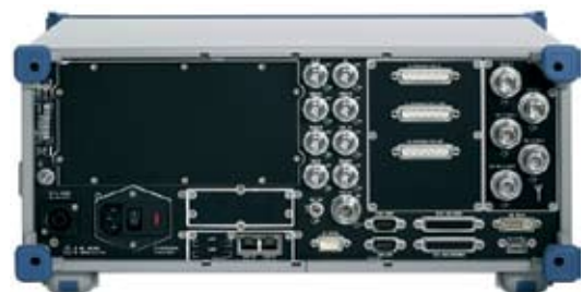
Задняя панель R&S®ESMD.

Благодаря небольшому размеру и многообразию специальных функций, R&S®ESMD идеально подходит для обнаружения любого рода помех. Для решения этих задач предусмотрены специальные функции, такие как настраиваемое время измерения и непрерывный (с усреднением) или периодический (максимальное значение за время измерения) вывод уровня. Поскольку эти функции применимы и к радиочастотному спектру, можно легко обнаруживать даже непериодические помехи, которые, в противном случае, легко пропустить в быстромеменяющемся спектре, потому что они возникают через случайные интервалы времени. В результате, источники помех можно быстро обнаруживать и устранять. Это особенно важно в тех случаях, когда нужна высокая защищенность радиоканалов (например, в авиационной радиосвязи или управлении воздушным движением).