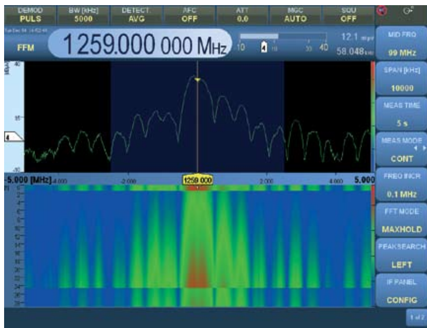
Обнаружение и анализ импульсного сигнала радара.

Функция панорамирования на промежуточной частоте позволяет тщательно исследовать спектр сигнала и сигнальную обстановку. Текущая частота приема располагается в центре выводимого спектра. Полосу обзора можно установить в диапазоне от 1 кГц до 20 МГц и, таким образом, оптимально адаптировать к решаемой задаче. Функции удержания минимума и максимума и функция усреднения дополнительно расширяют возможности прибора.